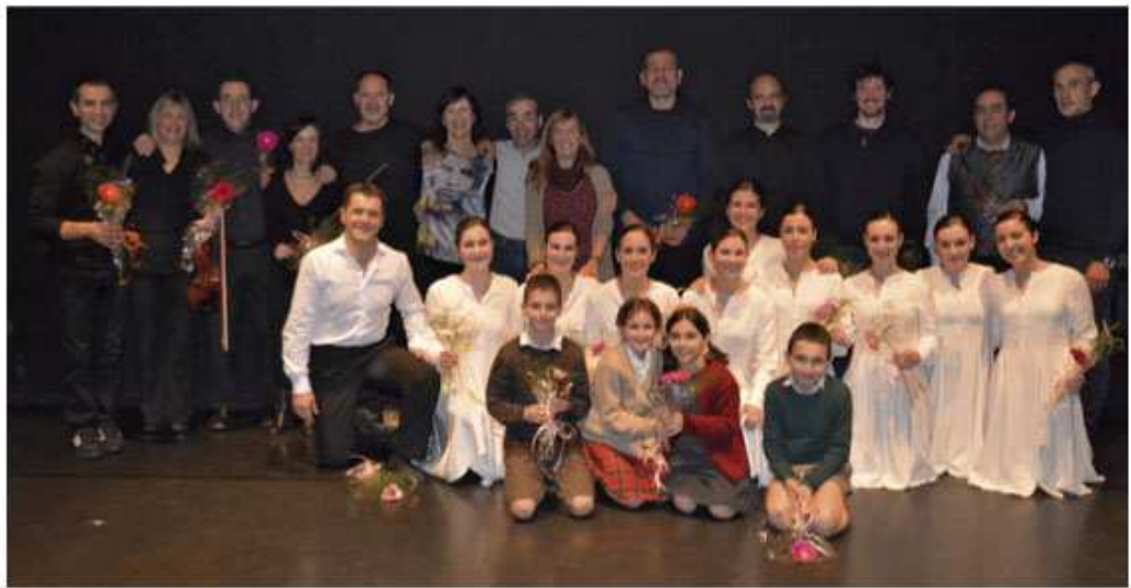
Hiru garren antzezpeneren ondoren pozarren agertu ziren taldekide guztiak.