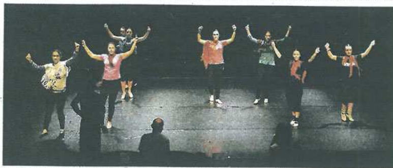
Un momento de los ensayos de la obra que se escenificará el próximo fin de semana.

zas guipuzcoanas y resulta paradójico el rigor con que se consideró su obra, y la manera en la que el autor vivió su vida, por encima de todo haciendo las cosas a su manera, siendo libre, amando apasionadamente, costara lo que costara.