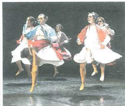
Urnietarrak. Egapeko dantzariak 'Zuria gure erara'-n.