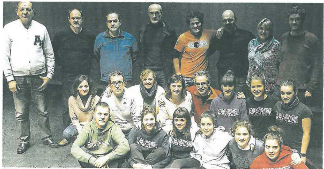
Sarobe acogerá el espectáculo de danza 'Zuria, gure erara' en el que han participado Egape Dantza Taldea y Anabas Musika Taldea.

Para los que no lo sepan, Juan Ignacio Iztueta 'Zuria' nació en Zaldibia en 1767 y murió en la misma localidad en 1845. Vivió en una época convulsa con la ilustración, las francesadas o la primera carlistada. Tuvo una vida tan larga como plena o azarosa, destacado bailarín, se casó tres veces, estuvo en la cárcel, y escribió varias publicaciones en euskera. En este contexto, en 1824 edita el libro recopilatorio de las dan-