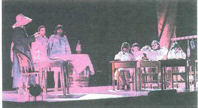
Segurarrak. 'Ez dira aspaldiko kontuak' antzezlanean 32 lagun aritzen dira guztira.