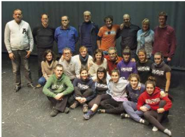
Eguberrietan burubelarrir aritu dira ikuskizuna prestatzen.