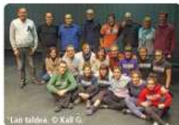
Lari Taldea.

Guretzat garrantzitsuena da obraren atzean dagoen mezua. Publikoarekin me- zu bat partekatu nahi dugu edo, nolabait ere, ikusleengan eztabaida sortu. "Marizulo" ikuskizunean helarazi nahi genuen galdera zen: ezagutzen al duzu Urrietako historia? "1959" obran bi mundu ikuspe- gi landu nahi genituen: euskaldunena eta urte horietan atzeretik Euskal Herrira zeto- zenena. Mezua zen, ez bata eta ez bestea, inor ez da bestea baino hobea, ezberdinak