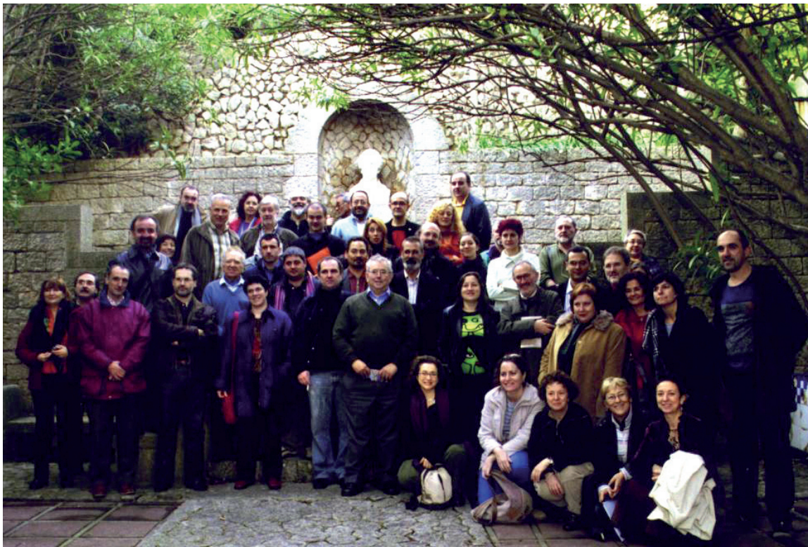
2005ean XXII. Galeusca Gironan ospatu zen. Idazle galegoak, euskaldunak eta katalanak Tradició i dissidència gaiaren inguruan aritu ziren