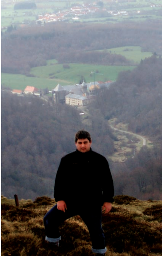
Joxemiel mendizalea Orreagan gaindi Ortzantzurietan

biziaren partaide izan zen, aipatutako Nafarkaria aldizkariko «Klasiko bitxi arrontz klasiko» sailaren egile eta Iruñerriko Euskalerrria Irratiaren ohiko kolaboratzaile bezala. RIEV aldizkarian «El euskara en los medios de comunicación navarros durante el siglo XX: incidencia de la Ley del Vasculence en la información» argitaratu zuen (2001), gerora euskaraz itzulia Ele-ria aldizkarian: «Euskararen Foru Legeak komunikabideetan izan duen eragina» (2003) izenburuaz.