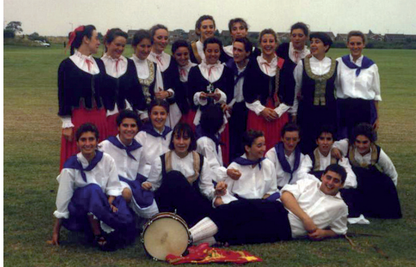
Bidador beti jostari, aske... 1992an Duguna dantza taldearekin Kirkleatham Inter Tie nazioarteko jaialdian

Bidador euskal dantza tradizionalaren historialarien artean. Dena den, horren guztiaren gainera, lankideek asko estimatzen zuten Bidador. Ezagutza handia bazuen ere, Euskal Herriko Unibertsitateko Filologia Fakultatean jarri zizkioten oztupoek galarazi egin zuten Bidadorren irakaspena unibertsitate munduraino hel zedin.