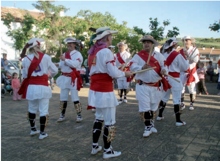
Bidador alaiki aritu zen dantzan Baternaingo herriko plazan, 2008ko festen hasieran