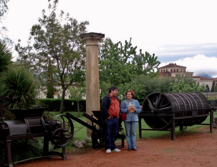
2007an Guardiako ardoaren museoa, ardo dastaketa egin eta gero. «Ardoak bizi arazten nau bizi arazten nauenez, ez ordea zentzu bakiarrean, zentzu epikureoan, zentzu hedonistan...»