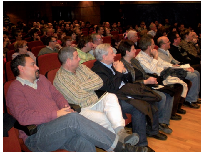
2011ko martxoaren 25ean Iruñeko Planetarioan eginiko poesia errezitaldian hainbat idazlek eta kultur gilek parte hartu zuten