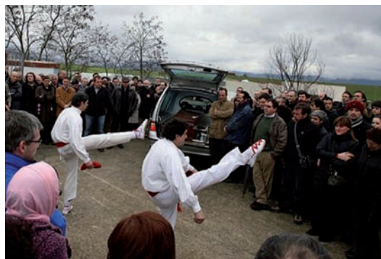
Baternaingo hilerriaren atarian azken agurra, 2010eko martxoaren 3an