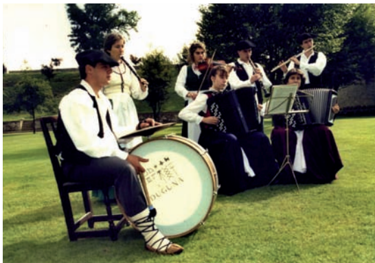
Bidador dantzaria ez ezik Duguna fanfarreko kidea ere izan zen