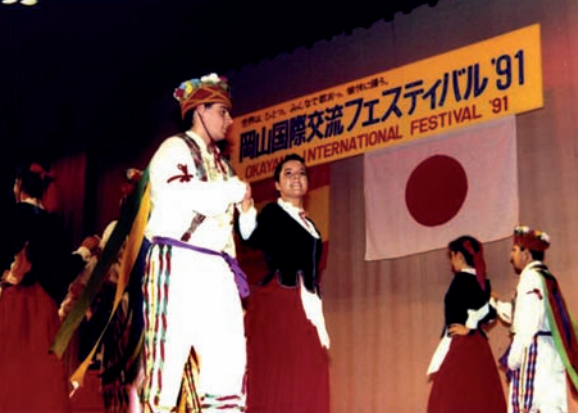
1991n Duguna dantza taldearekin Okayamako (Japonia) nazioarteko jaialdian

tzariak eta Larratz taldeetan ere aritu zen. Bestalde, San Lorentzoko Dantzanteen (1997) sortzaileetako bat izan zen, eta talde horretan jarraitu zuen dantzan hil arte.