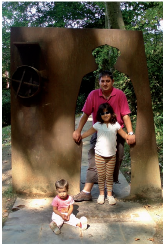
Bidadortarrak aita Barandiaranen itzalpean, Saran, 2009an