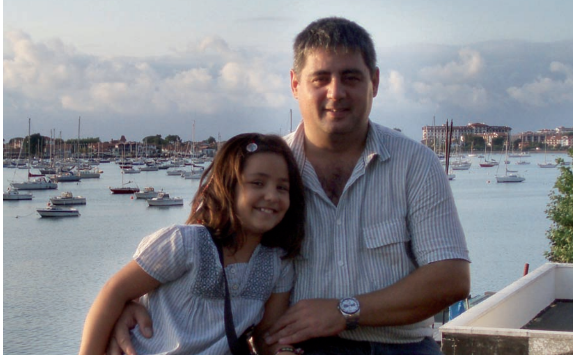
Aita-alaba Txingudiko badian (2009)

rrantzia ezinbestekoa izan da hizkuntza literarioaren eredia sortzeko eta egitura-tzeko; are gehiago, gure kasuan, hizkuntzari arrotz zitzaizkion oztopoei ez ezik, tradizio ezaren eta euskalkien bereizketaren berezko zailtasunei ere egin behar baitzien aurre.