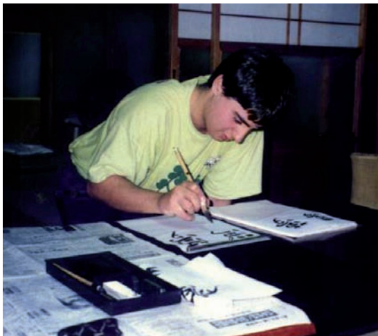
1991n Japonera eginiko bidaian bertako idazkeran saiatu zen