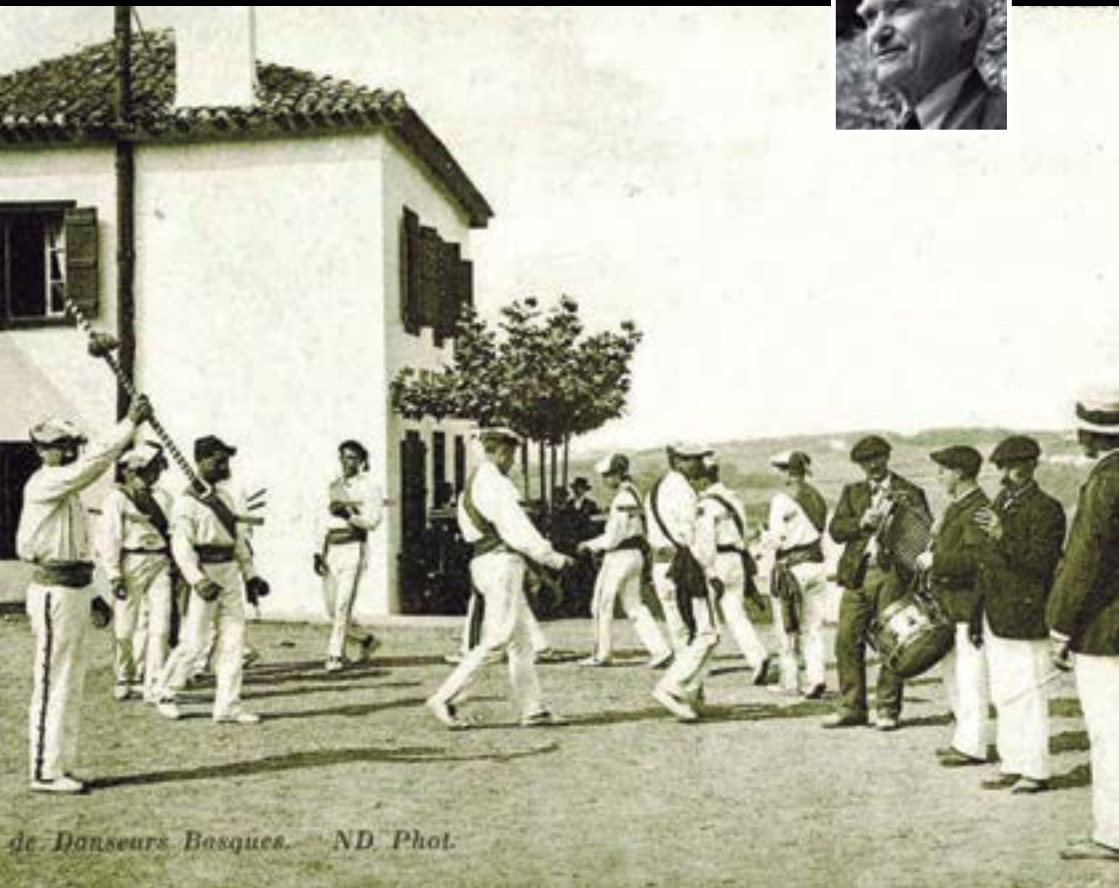
de Danseurs Bosques.