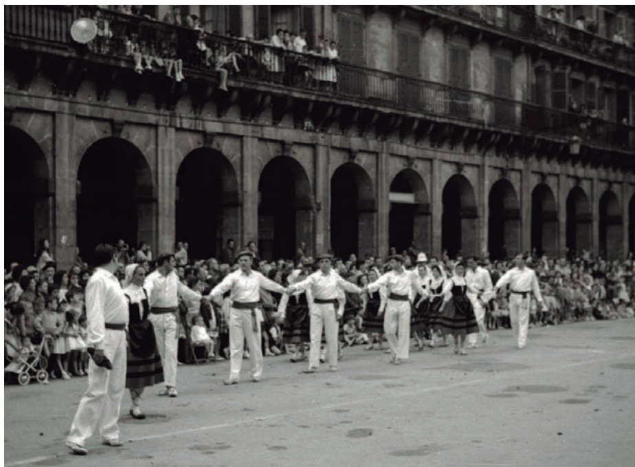
Donostiako Konstituzio Plazan, San Joan Bezperako soka-dantzan, 1950ean.