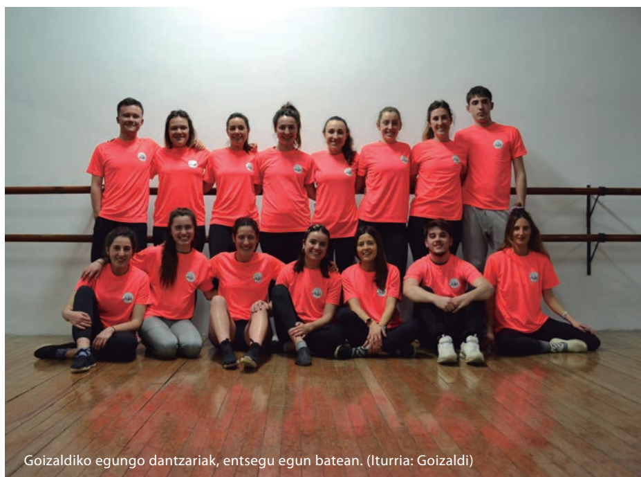
Goizaldiko egungo dantzariak, entsegu egun batean.

Dena den, baikor begiratzen diote geroari: “Zailtasunak gaindituko ditugu. Argi dago herritarrek oraindik ere dantza eskatzen dutela plazetan. Urtean zehar hainbat ekintza egiten dugu, eta jendeak propio bezala sentitzen ditu, ordezkatuta ikusten du bere burua”. Dantzariak ere gogotsu daude, ikasitakoa zabaldu eta gauza berriak probatzeko prest. Kultura kontzeptuak adierazpen estetiko gero eta estandarizatuagoak soilik biltzen dituela dirudien garai globalizatuotan, turistuholdeen azpian itotako Donostia honean, ez da gutxi jendeak dantza gosea edukitzea. ●