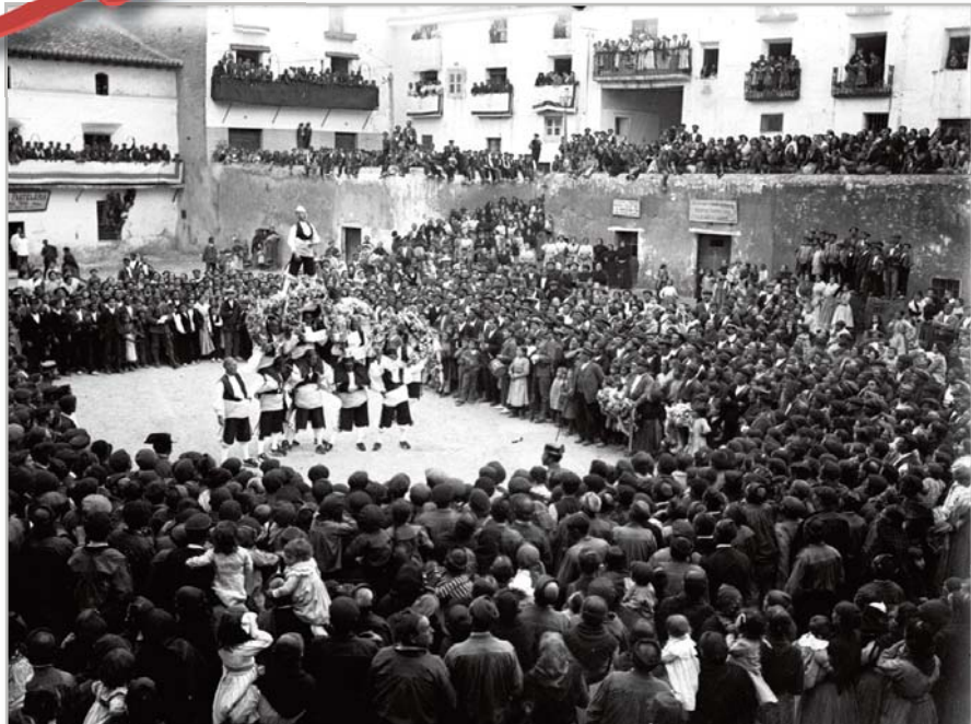
Tausteko dancea, Torre de Caballos, 1915.

zpalak, dantza tradizionalaren nazioarteko jaialdia