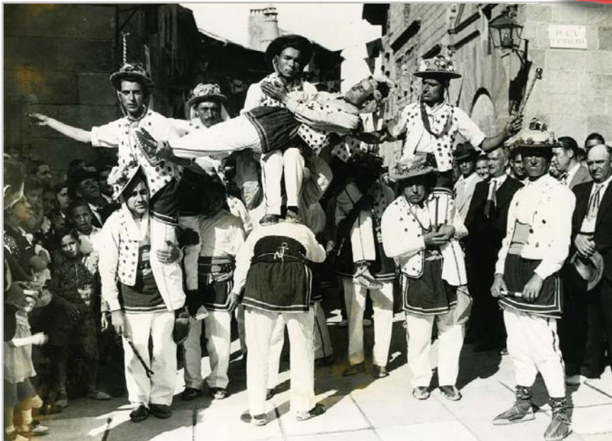
Moixiganga, Festa Major del Poble Espanyol, Sitges 1930.