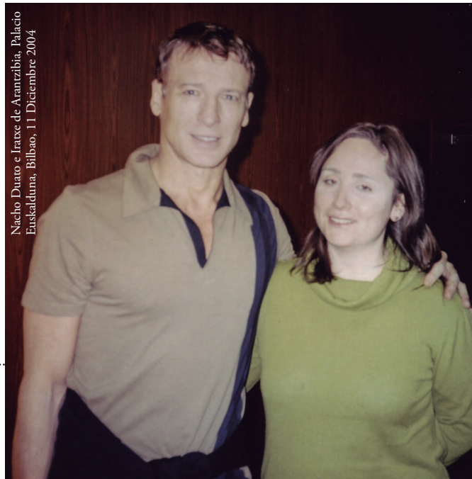
Nacho Duato e Iratxe de Aranzibia, Palacio Euskalduna, Bilbao, 11 Diciembre 2004

IA- Llevo veintiún años publicando ininterrumpidamente en diversos periódicos, suplementos, revistas