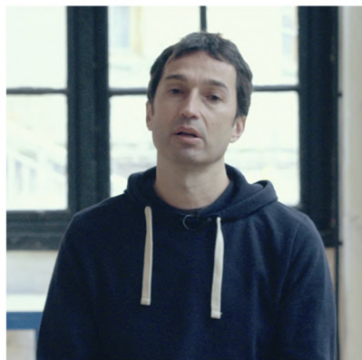
OIER ARAOLAZA Dantzan Elkartea