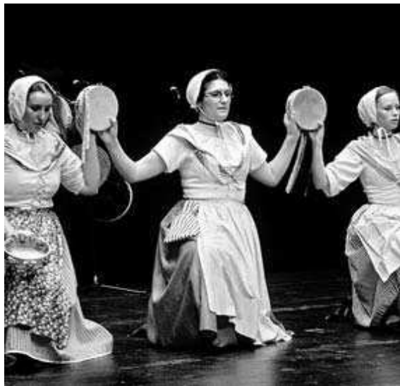
Un momento de la actuación del grupo de Provenza.