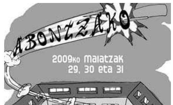
Las fiestas de Abontza ya cuentan con un cartel festivo.

Además, por primera vez, las actividades abarcarán más de un fin de semana. De cualquier forma, el grueso de los actos festivos con comida, atracciones infantiles y verbenas se celebrará el próximo fin de semana. ■