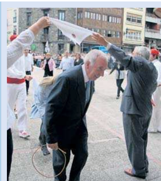
DOS ACTOS DEL DOMINGO. El baile de la sokadantza de autoridades y el XXXIX torneo internacional de ajedrez.

Fue una pena la tormenta de la tarde que obligó a que la fiesta se celebrase debajo de una carpa. ■