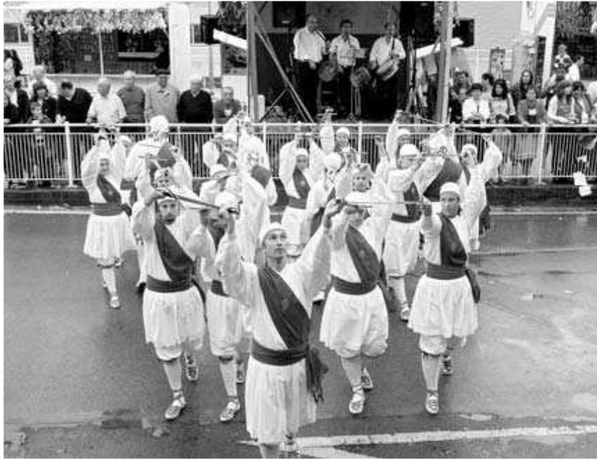
KEZKA. El grupo en las fiestas de Amaña, bailando 'Arrateko Amaren Ezpata'.

«Creo que esto responde más a una cuestión general que local, de