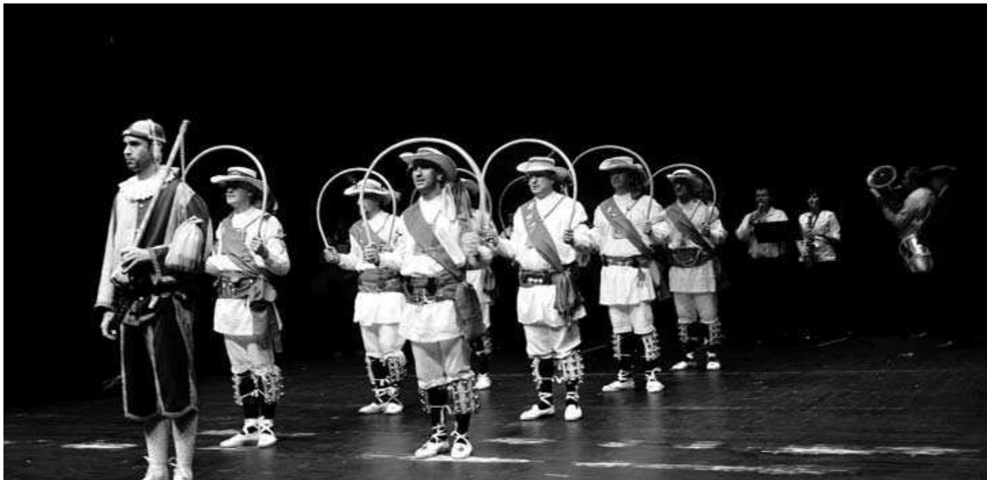
FOLCLORE. El certamen de 'Ezpalak' se celebrará en Unzaga y se trasladará al Coliseo en el caso de que llueva.