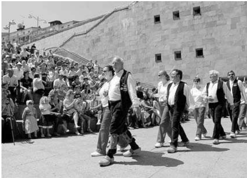
DIVERSIDAD. Actuación de un grupo folclórico de Amberes (Bélgica) en Eibar.

Para estas próximas jornadas se anuncian los juegos de Betizu en Unzaga, el taller de txalaparta en Arrate Kultur Elkarte y el festival 'Bertsoa & Jazza' en Coliseo (viernes). Para el sábado se ha organizado la feria de artesanía y