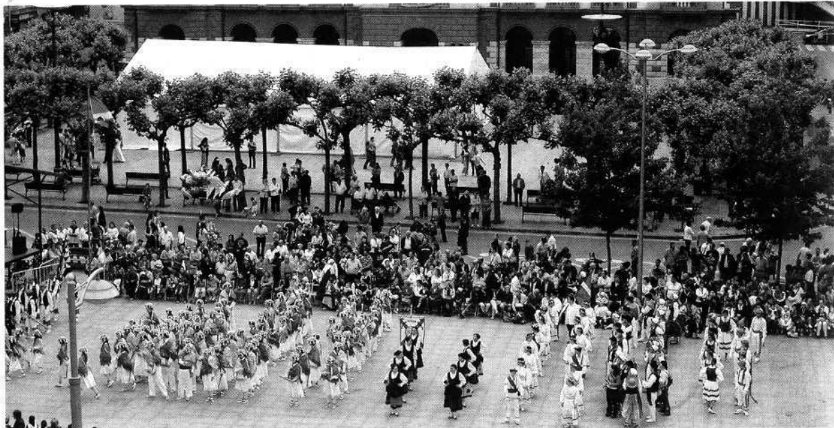
Grupos de dantzaris bailan en Untzaga durante una edición anterior de la Euskal Jaia eibarresa.

La asociación de radioaficionados de Eibar convoca a todos sus socios para que acudan a la asamblea anual que tendrá lugar el próximo día 30 de mayo, a partir de las 16.30 horas, en el restaurante Kantabria de Arrate. Previamente, los miembros de la entidad celebrarán una comida de hermandad en el mismo lugar. El precio de la comida es de 30 euros y las personas interesadas en asistir deberán apuntarse previamente llamando al número de teléfono 652 775762. >J.L.