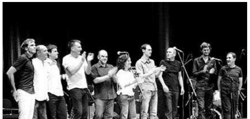
FUSIÓN. Bertsolaris y músicos del espectáculo saludan tras una de las funciones.