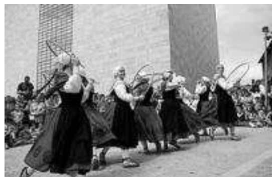
Iruñeko Duguna taldea arituko da jaialdian, besteak beste.

Teknika zorrotza eskatzen dute dantzok. Urrats konplexu eta finduak harilkatzen dituzte