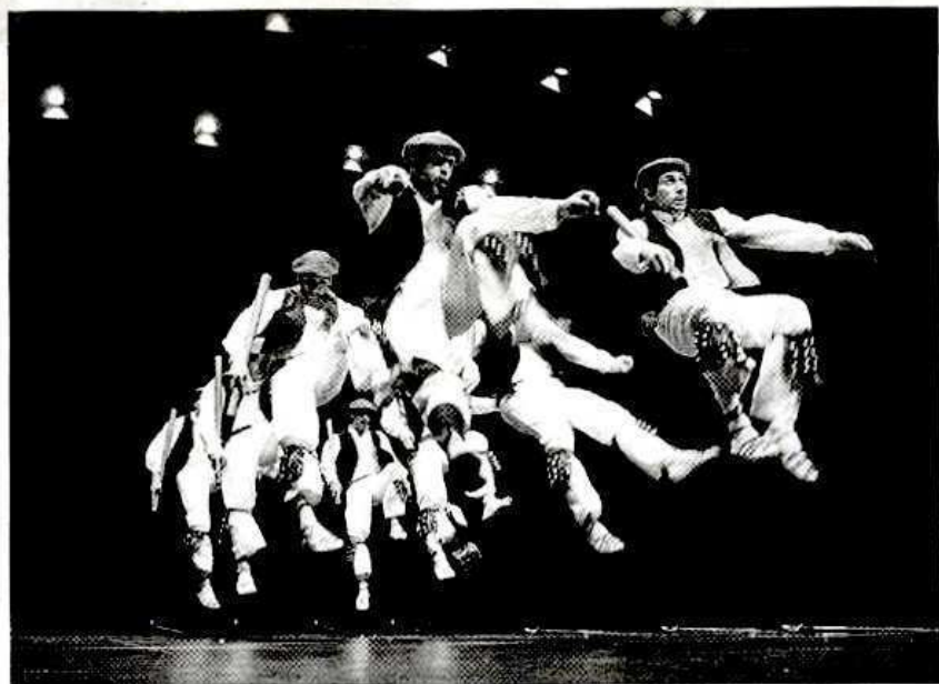
Goian, Berrizko San Lorentzo dantza taldea, Durangaldeko erregela dantza eskaini zuena. Ezkerrean, berriz, Proventzako Rode de Basse Provence taldea.

Proventzako L' Ancien Var bailaratik, eskualdeko dantza, musika eta janzkeran erreferentzia den bailaratik iritsi zen, berriz, Rode de Basse Provence taldea. Karaktere dantzak eskaini zituzten, armadako dantza-maisuek erakutsitakoak. Horiek ere la gavotte, «l'anglaise», «le pas grec» eta «l'arqueline» deituriko urrats bezala, le pas basque txertatu dute euren dantzetan.