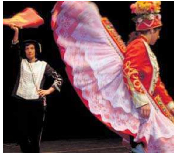
Uno de los dantzaris de Aitzindariak de Zuberoa.