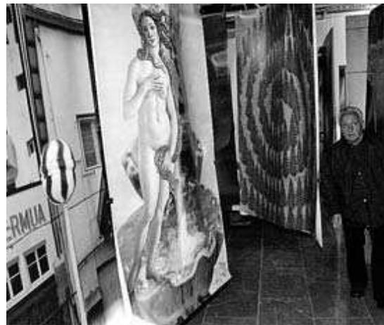
Imagen de una exposición pictórica celebrada en Ermua.

Subvencionará aquellos programas de marcado carácter so-