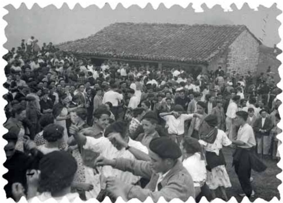
San Kristobal erromeria Oiz-en (Bizkaia).