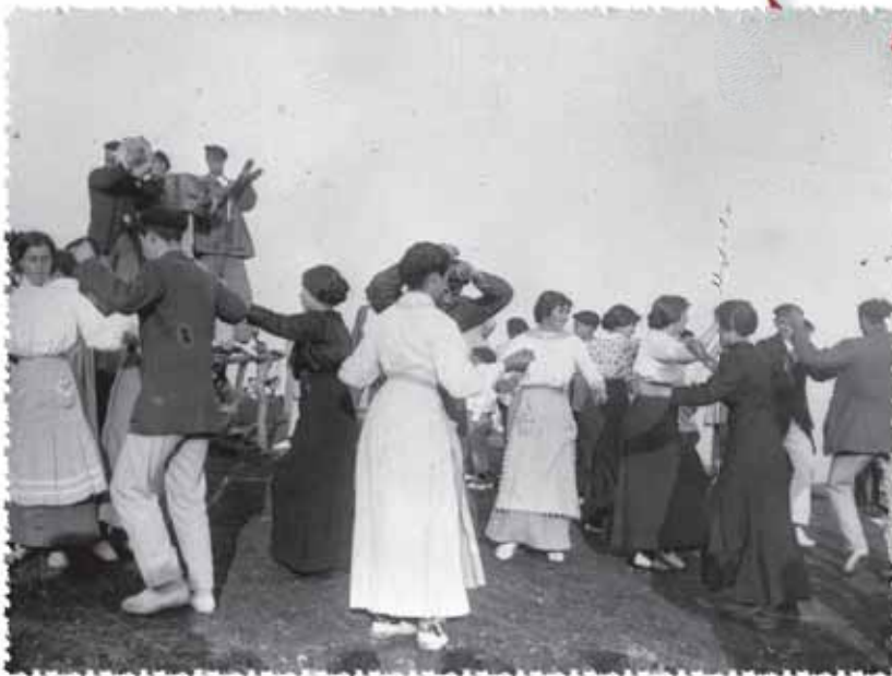
Erromeria Ixuan (Eibar), XX. mende hasieran.