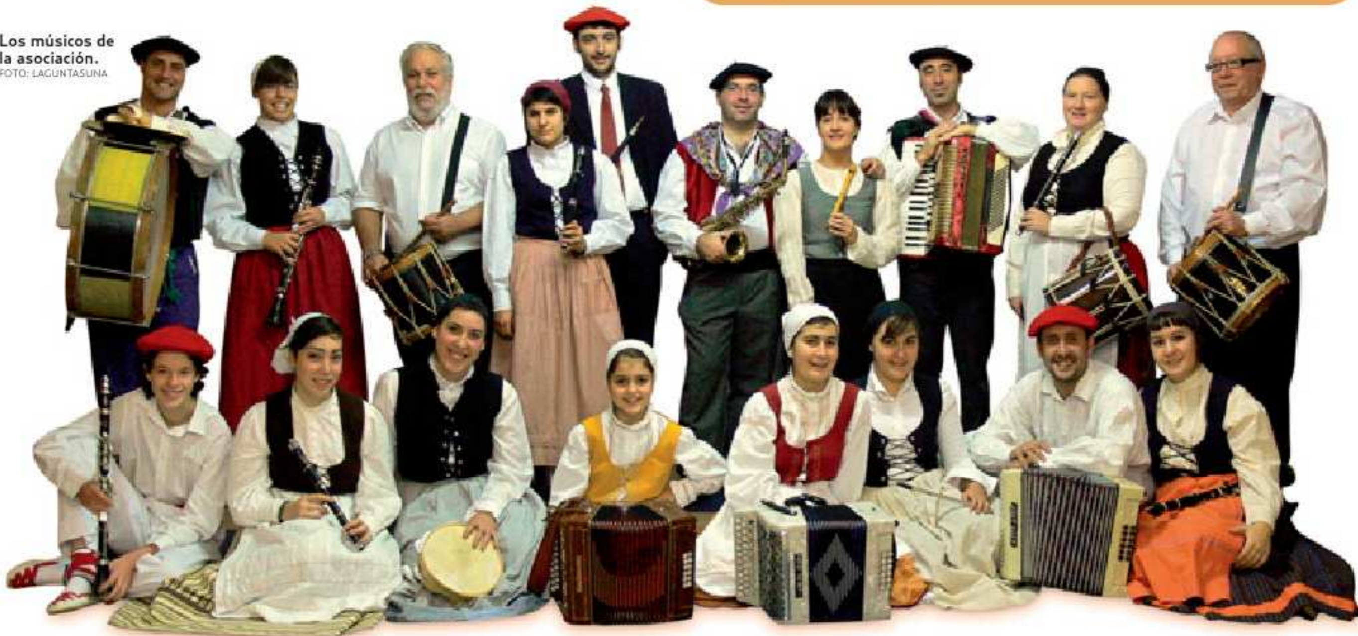
Los músicos de la asociación.

Una de las apuestas del programa de aniversario es la gran actuación de dantzaris txikiak que Laguntasuna está preparando para el próximo 9 de mayo. En la plaza de San Bizente, grupos venidos de toda Euskal Herria mostrarán lo mejor del folklore vasco para unir a las celebraciones de este especial cumpleaños. De momento, hay confirmados más de 15 grupos. Pero, además, Laguntasuna ha programado actuaciones especiales, como la de los dantzaris de Maule (26 de septiembre), el grupo de música Miel Otxin de Nafarroa (31 de octubre) y Oberena Dantza Taldea de Iruña (28 de noviembre). Todos estos espectáculos tendrán lugar en la Casa de Cultura Clara Campoamor. Además, el 12 de diciembre (fecha muy próxima al día del aniversario oficial), Laguntasuna celebrará la tradicional comida de hermandad que tiene lugar cada cinco años. Todos estos actos se suman al programa de actuaciones que completará la asociación a lo largo de los próximos meses y que, por las circunstancias, serán para todos algo más especiales de lo habitual.