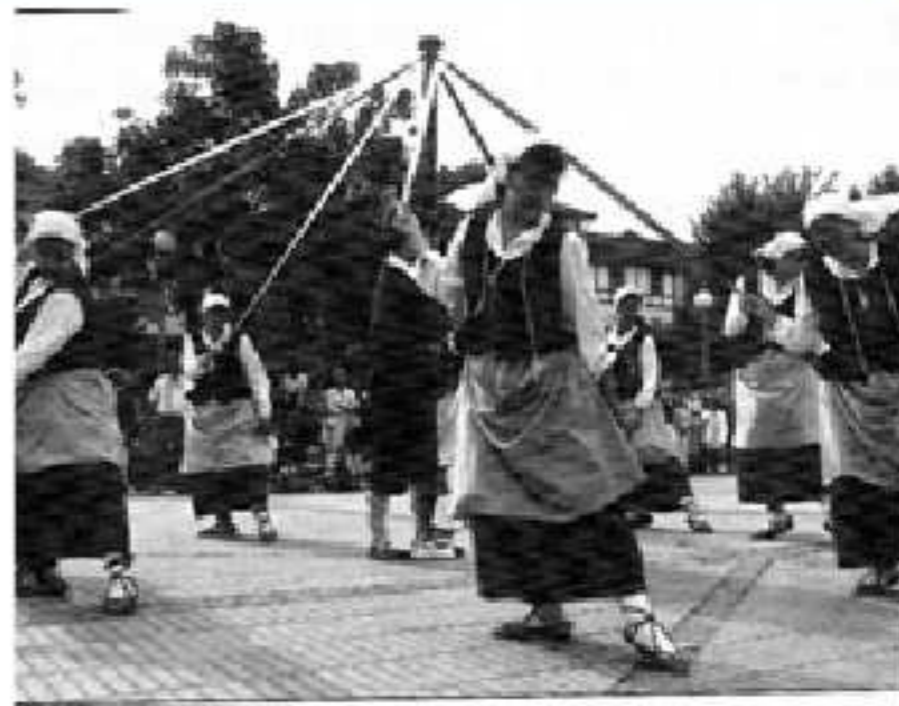
Laguntasuna considera como la fecha oficial de su aniversario el día de su primera actuación, que se produjo el 8 de diciembre de 1949.