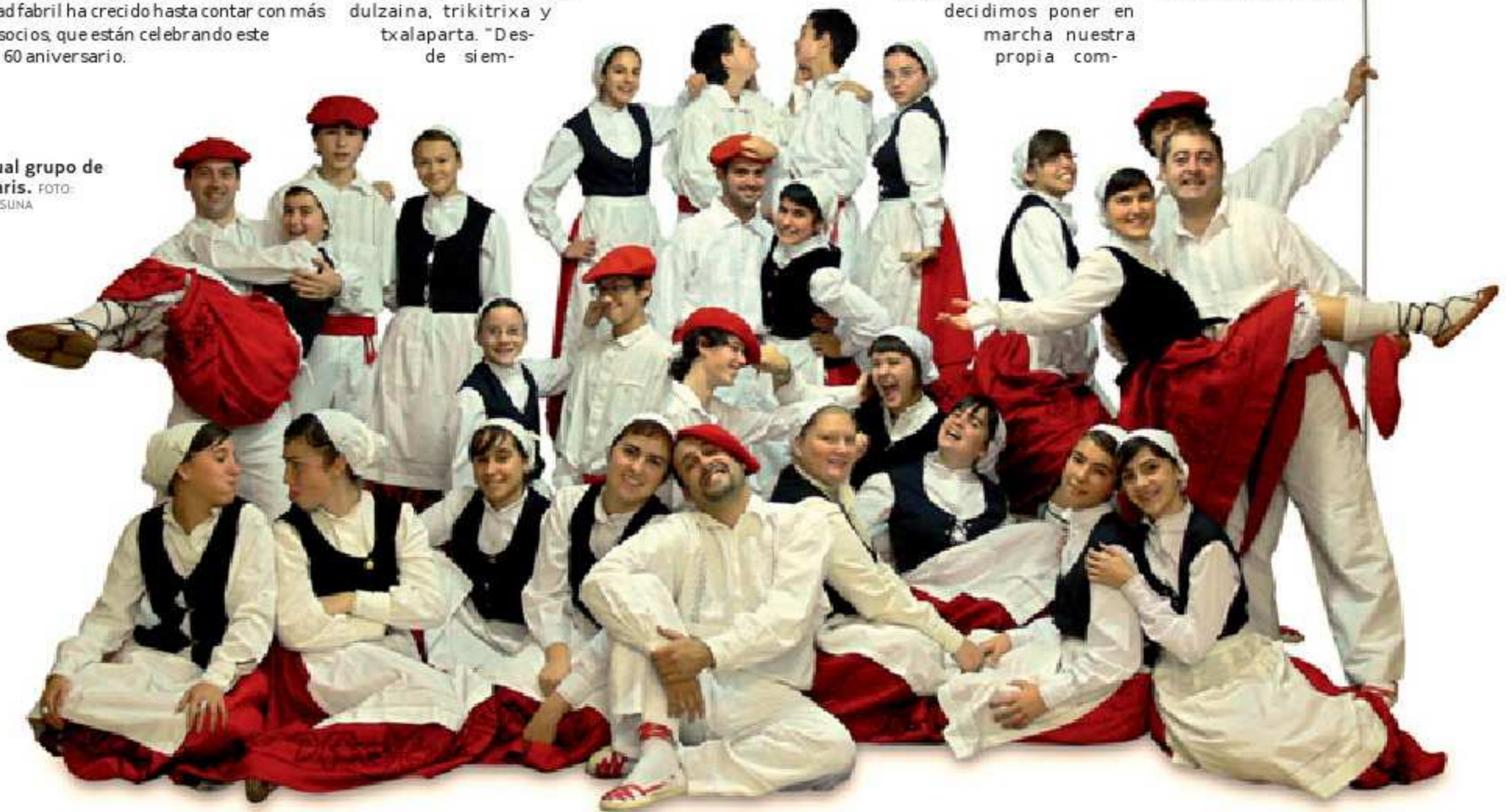
El actual grupo de dantzaris.